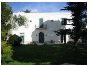
Andria - Torre di Bocca

È stato in giuria nei concorsi Internazionali di chitarra di Alessandria (1997) e Camogli (2004) e in quelli nazionali di Abbiategrasso (MI) e Mirabello (CB) nel 2008. Collabora con il Concorso Internazionale Fundacion Guerrero di Madrid.